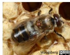
Varroa sur faux-bourdon