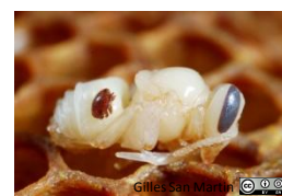
Varroa sur nymphe