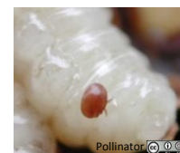
Varroa sur larve d'abeille